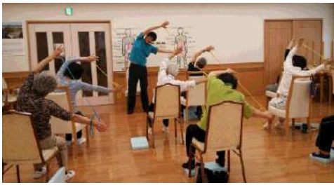
けんこう体操教室の様子。介護保険サービスではないので、どなたでも参加していただけます。