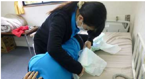
介護従事者のニーズに即した資格の講座を展開していきます。