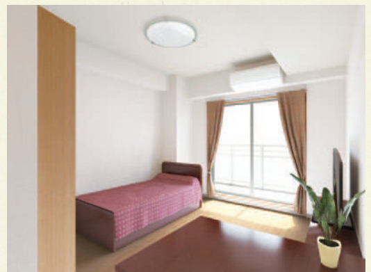
居室イメージ（家具は付いておりません）